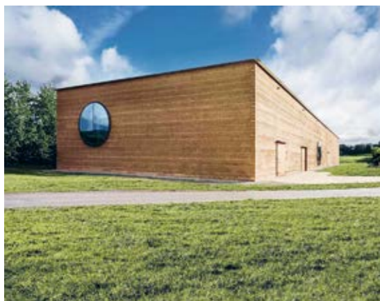
La maison des plantes de Ricola serait le plus grand bâtiment en pisé d'Europe. La structure porteuse est en béton armé. La façade en pisé de 45 cm d'épaisseur est auto-porteuse. Architecte : Herzog & De Meuron.