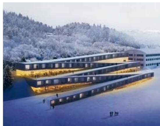
Hôtel des Horlogers, Le Brassus Bâtiment en béton et bois apparents, géométrie complexe, Minergie-ECOBois de la Vallée de Joux (Labels COBS et FCS), valorisation sur site des matériaux d'excavation et de la terre végétale.